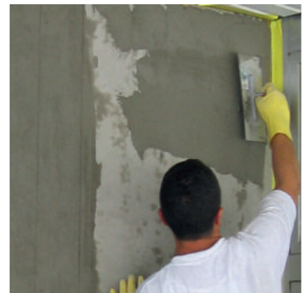
PCI Barrafill L für Kosmetikarbeiten an Betonbauteilen.